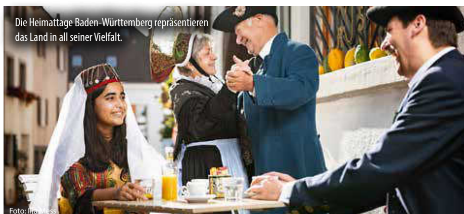
Die Heimattage Baden-Württemberg repräsentieren das Land in all seiner Vielfalt.