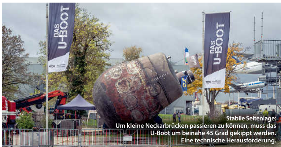
Stabile Seitenlage: Um kleine Neckarbrücken passieren zu können, muss das U-Boot um beinahe 45 Grad gekippt werden. Eine technische Herausforderung.

Insgesamt investierte der Verein Auto-Technik-Museum rund 2 Millionen Euro in das Projekt. Doch das, so Einkörn, habe sich gelohnt. (ral)