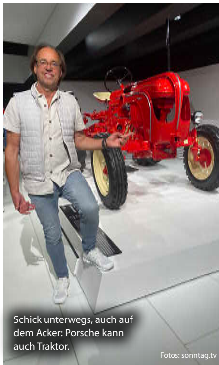
Schick unterwegs, auch auf dem Acker: Porsche kann auch Traktor.